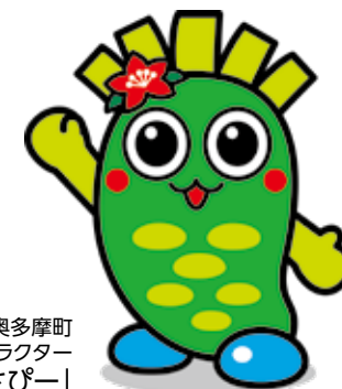
奥多摩町 イメージキャラクター 「わさぴー」