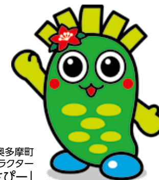
奥多摩町 イメージキャラクター 「わさびー」