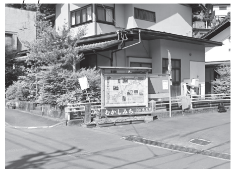
この看板ある交差点を右折してすぐ左折すると 旧青梅街道のむかし道に入ります。