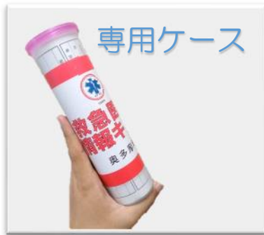
大きさは 500ml ペットボトル程度