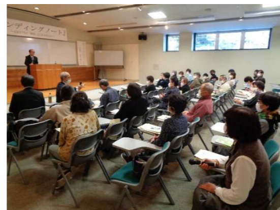
↑ 質疑応答にも熱が入っていました。

今後も地域包括支援センターでは、ご高齢者やその生活を支えるご家族に向けた、役立つ情報を提供できるように取り組んで参ります。