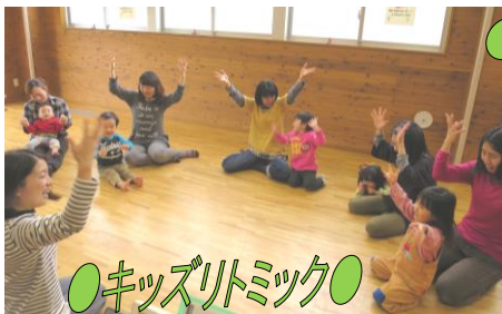
●キッズリトミック●