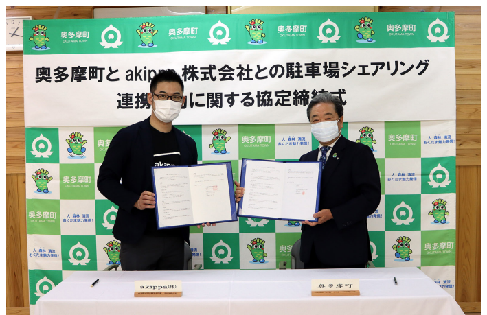
▲4月21日の協定締結式（師岡町長（右）、小林取締役（左））