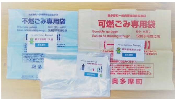
▲販売したゴミ袋 (可燃・不燃・資源 3枚1組 500円)