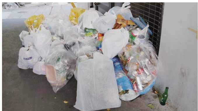
▲週末に置き去りにされたゴミ (ゴミの置き去りは後を絶ちません)