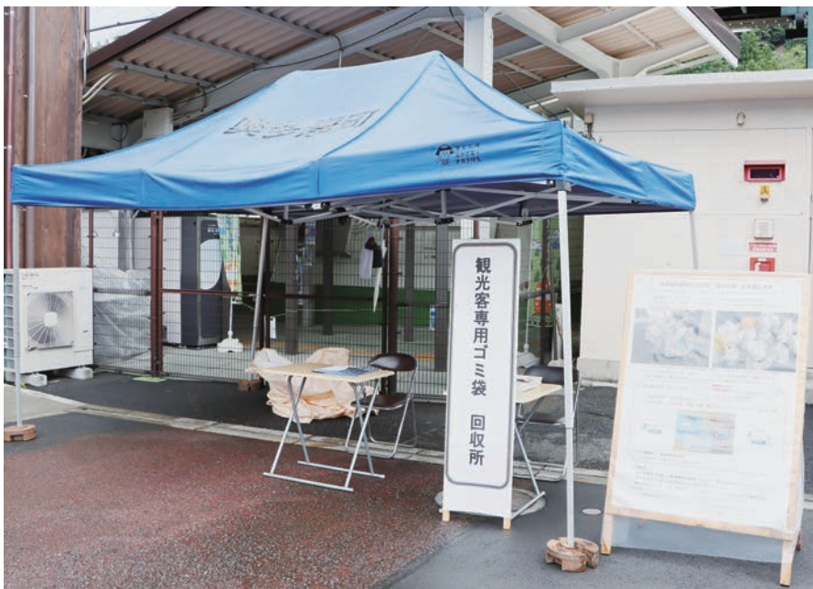
▲奥多摩駅前に設置した回収所