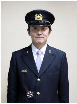
▶ 清水副分団長・第2分団