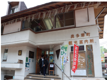
▲奥多摩駅前の「観光案内所」