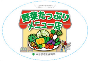
▲このステッカーが目印です

1日に摂りたい野菜の量（目標量）は350gです。東京都保健所管内には、1食でこの約3分の1量の120gが食べられるお店「野菜メニュー店」が約450店舗あります。この取組は、外食する機会が多く、野菜摂取量が目標量に達していない都民のみならず、外食で野菜をたっぷり食べてもらうために始めました。健康的な食生活に欠かせない野菜の摂取量アップに繋げるため「野菜メニュー店」を、ぜひご利用ください。