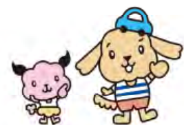
ちょころ ちょこ助