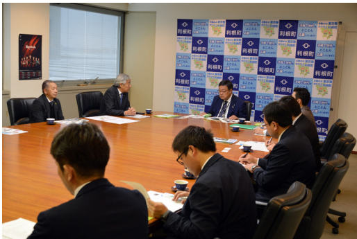
▶利根町役場にて 当時・現在の状況を説明