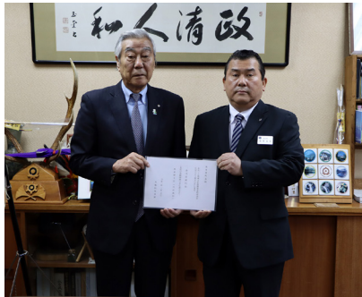
▲左から河村町長・梶野奥多摩支店長