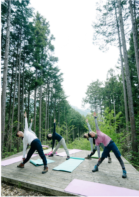
▲森林ヨガ(登計トレイルにて)

③萌え木の登計歩き+森林 ヨガ②「新緑ベストシーズ ンの奥多摩森林セラピー」 5月1日(金)