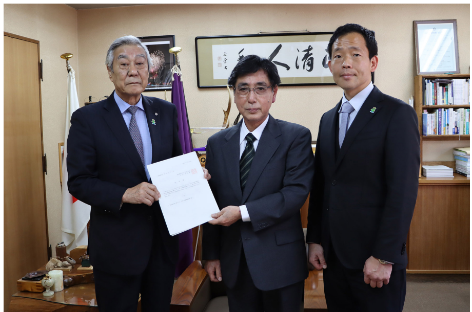
▲左から河村町長、杉村誠二会長、拝原茂行副会長