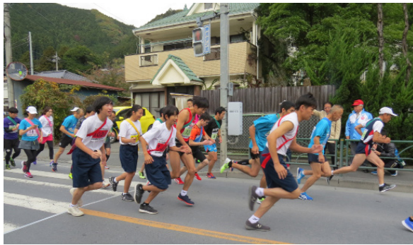
▶前回大会スタートの様子

多数のチームの参加をお待ちしています。 〔日時〕12月1日（日）〔コース〕青梅市役所前