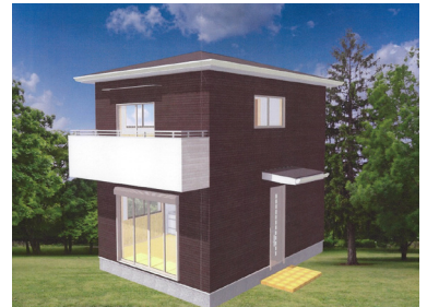
▲住宅の完成イメージ図