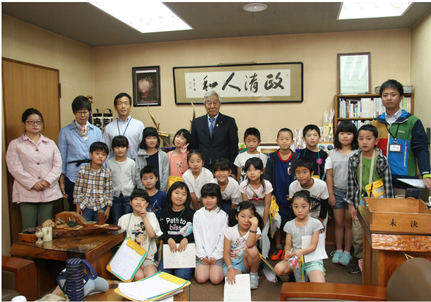
▲町長室にて記念撮影