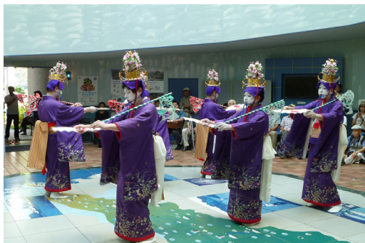
▶ 小河内の鹿島踊り