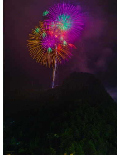
第34回ふるさと奥多摩 写真コンクール入選作品