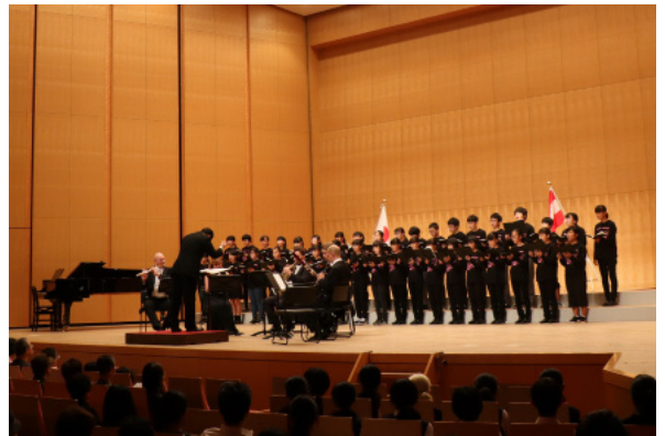
▲昨年の合唱団交流演奏