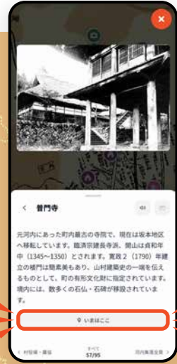
小河内タイムレンズ