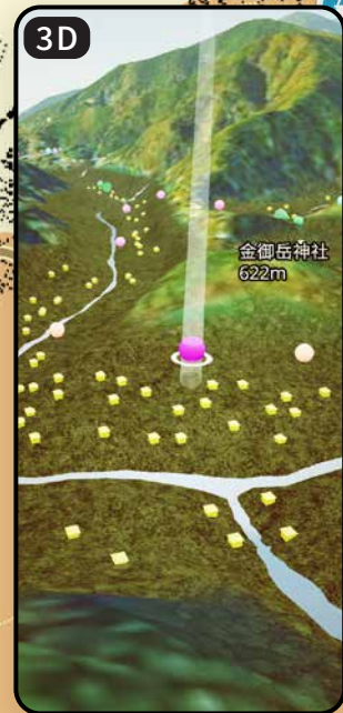
3Dモードは、湖の近くでのみ体験ができます。