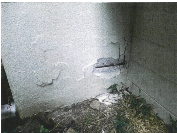
劣化状況（コンクリート爆裂、鉄筋露出）