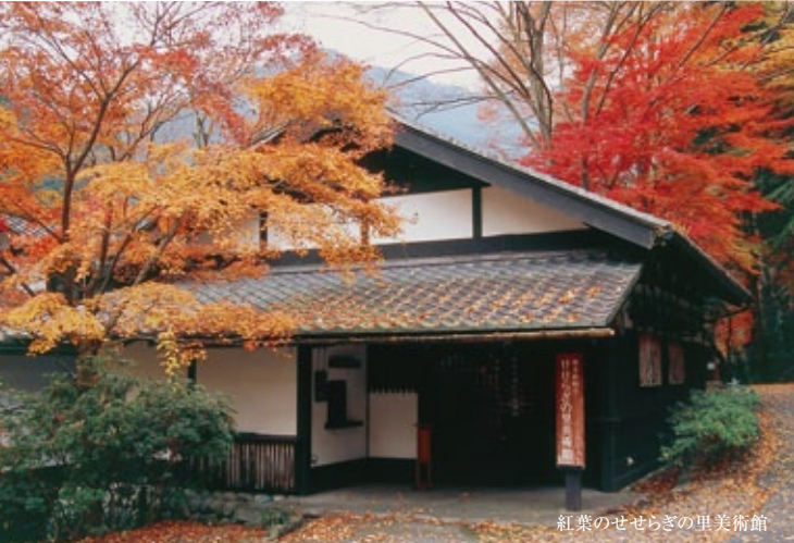
紅葉のせせらぎの里美術館

飯能市・青梅市内経由 青梅街道で いずれも青梅街道御嶽駅前交差点より、奥多摩方面へ1.5km