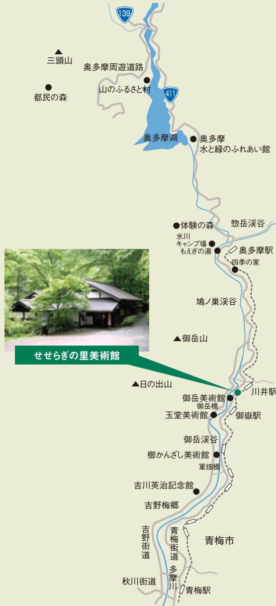
せせらぎの里美術館