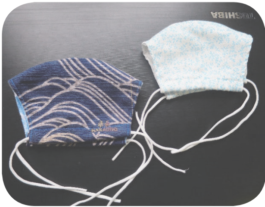
住民の方の「手作りマスク」です！ コロナ対策工夫していますね！

請願・陳情は！ 9月定例会では、8月17日まで に受理したものを審議します。提出する際は、次のことにご注意ください。 ①請願には必ず1人以上の紹介議員が必要です。(陳情は不要です) ②請願・陳情者は、住所・氏名・電話番号を必ず記載し、署名(記名の場合は押印)してください。 ③提出は議会事務局へご持参ください。(郵送不可) ④詳しいことは議会事務局にお問い合わせください。