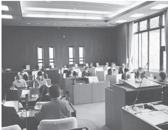
コロナ感染防止からマスク着用での定例会となりました!