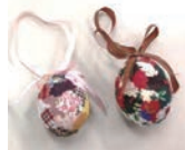
『エッグオーナメント』 (卵の殻で作る装飾品) を作りました！

※この活動は、コープの子育て・高齢者支援事業の一つで、地域の居場所づくりを目的としており、営利を目的としていたものではありません。 ※状況で中止になる場合があります。