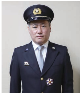
徳王分団長・本部分団