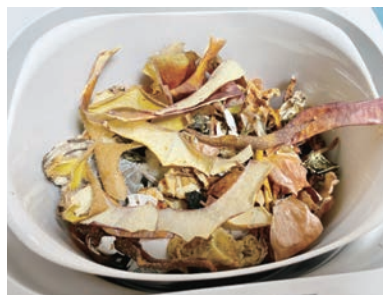
②生ごみ処理機で乾燥させた後