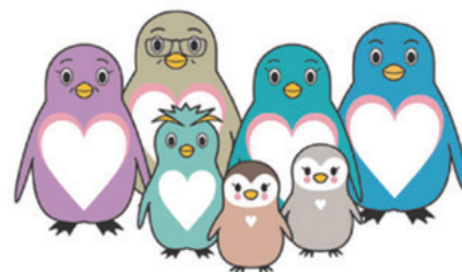
東京都里親制度普及啓発キャラクター「さとべん・ファミリー」