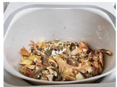
③乾燥させたものをつぶして小さくしたもの

ご覧のとおり、生ごみ処理機にかける前と、かけた後につぶしたものでは3分の1程度に減量されます。町では、コンポスト・生ごみ処理機を購入された方に購入費の一部補助事業を行っています。詳しくは、町ホームページまたはクリーンセンターへお問合せください。