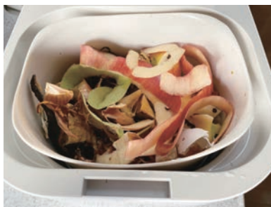
①生ごみ処理機にかける前