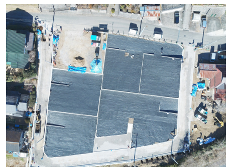
▲川井(松葉) 地内分譲地