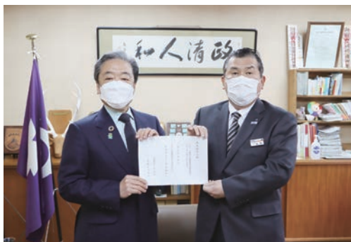
▶ 左から、師岡町長、 梶野奥多摩支店長