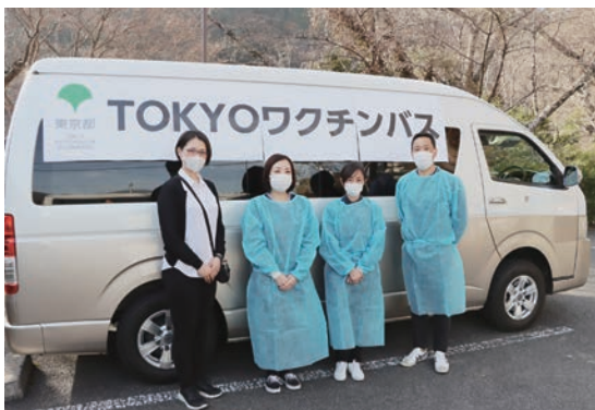
▶町内を巡回された、医療スタッフのみなさん

18歳以上の追加接種(3回目)についても、当初の予定を前倒しして実施しており、18歳以上の対象人口に対する接種率は、64・5%(3月28日時点)となっております。引き続き早期完了に向けて、みなさんのご協力をお願いいたします。追加接種・小児接種の内容などについては、2ページに掲載しています。