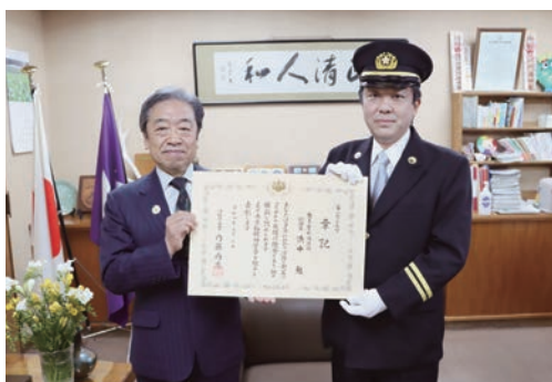
▶ 師岡町長（左）に 受章報告（3月9日）