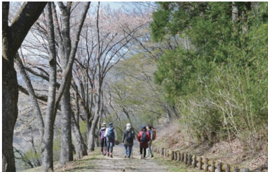
▶森林セラピーガイドウォーク

※問い合わせは、一般財団法人おくたま地域振興財団 ☎ 83-8855 FAX 83-8856