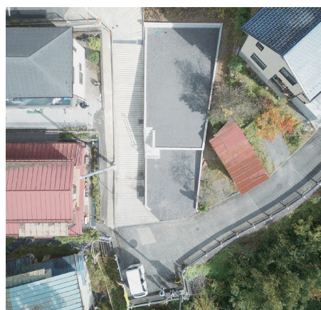
▲令和 7 年 11 月 1 日現在

子育て定住推進課 若者定住推進係（役場 1 階） 古里出張所（子ども家庭支援センター）