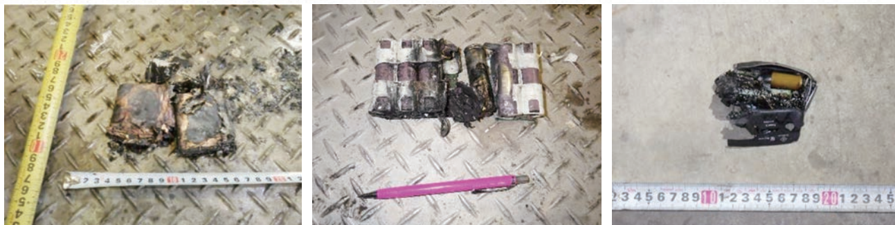
(処理中に発火したリチウムイオン電池の例：西秋川衛生組合内で発生)

リチウムイオン電池は、モバイルバッテリーなど、小型で大量の電力を必要とする製品に使用されています。そのため他の電池に比べて高容量、高出力、軽量という特徴があります。