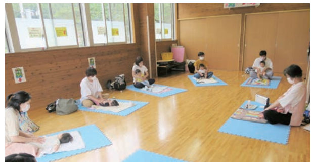
▲過去のベビーマッサージの様子